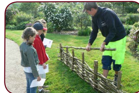
Animation enfants - Rendez-vous aux jardins