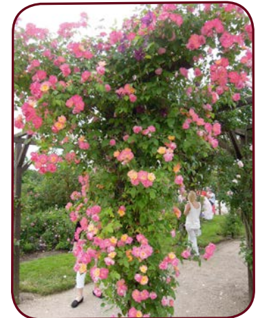
Sur la Pergola