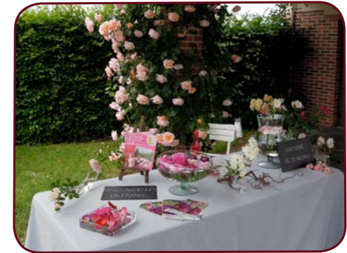
Accueil Congrès Lyon Roses - 1 er juin 2015