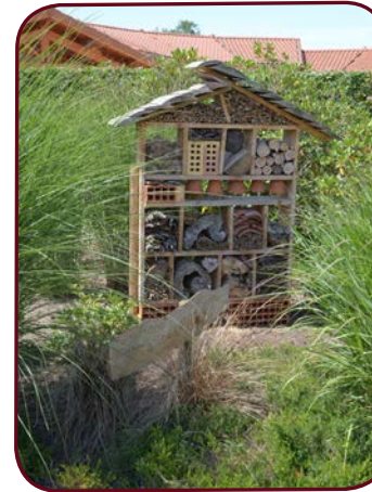
Hôtel à insectes